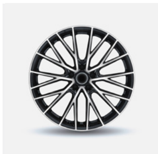
Stijl 9 zwart gepolijst