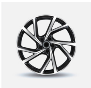
Stijl 2 zwart gepolijst