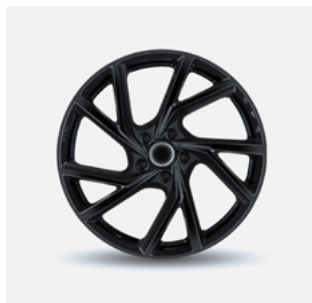
Stijl 2 hoogglans zwart