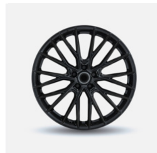
Stijl 9 hoogglans zwart