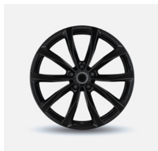
Stijl 12 hoogglans zwart