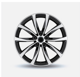
Stijl 12 zwart gepolijst